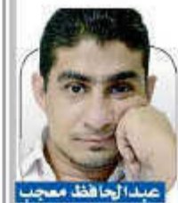
بقية صد 13

مؤخراً، وعقب عملية الاستهداف النوعية لمرتزقة العدوان في قاعدة العند الجوية بمحافظة لحج، ناقشت القناة الإسرائيلية العاشرة، عملية استهداف سلاح الجو المسير للعرض العسكري وتدشين العام القتالي في قاعدة العند، عبر برنامج تم تخصيصه لمناقشة وتحليل العملية وأبعادها ومخاطرها المستقبلية على تل أبيب، وخلال الحلقة قال أحد المحللين الصهاينة (إن فشل الرادارات والدفاعات الجوية الأمريكية الحديثة بالقاعدة في كشف الطائرات المسيرة التابعة للحوثيين، مسألة خطيرة تهدد الأمن القومي الإسرائيلي وحلفائنا في المنطقة).