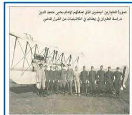
صورة لتلاميذ المعلمين الذي ابتعثهم الإمام يحيى حميد الدين لدراسة الطيران في إيطاليا في الثلاثينيات من القرن الماضي

أول بعثة طلابية ابتعثها الإمام يحيى حميد الدين إلى إيطاليا لدراسة الطيران عام 1937.