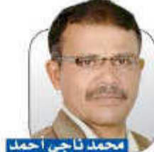
محمد ناجي أحمد

فكان خروج العثمانيين للمرة الثانية من اليمن. وفي بداية الألفية الثالثة كانت حركة الشهيد حسين بن بدر الدين الحوثي في صعدة، وشعاره ضد أمريكا وإسرائيل، ورفض التبعية لهما، حينها عمل النظام الحاكم وقتها على تجميع علماء الزيدية ومثقفها وسياسيها لإصدار بيانات نقد وتثني وتجريح ضد حركة الشهيد حسين وضد شعاره.