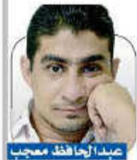
بقية ص 12

خلال الأسبوع الفائت تواصلت الاحتجاجات في مختلف مديريات محافظة عدن تحت عناوين مختلفة، منها ما خرج للمطالبة بتسليم جنود تابعين لقوات مكافحة الإرهاب المدعومة إماراتياً، وذلك بعد قتلهم شاهداً في قضية اغتصاب طفل بمدينة المعلا، وآخرون خرجوا لقطع الطرقات وإحراق الإطارات في المعلا والمنصورة وخور مكسر متهمين الإمارات ومرترقتها المحليين بالوقوف وراء عمليات اغتيال الأئمة وخطباء المساجد.