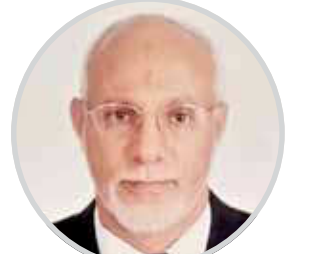
عميد الدبلوماسية اليمنية يكتب لـ«لا» خفايا المفاوضات من جنيف إلى الكويت 2

هو حديث الفطرة الإنسانية الإيمانية السوية، يتدرج في تناولاته وتعليقاته على ماضي الصراع وحاضره، وثوباً من أرضية متماسكة وصلبة من البدايات التي تقارب قاع اللحظة البشرية العميق، رغم عفويتها وسلاسة دفقها في أسماع العامة والخاصة والموالين والمبغضين على السواء. في كل مرة نزع أننا قد أحطنا علماً بتخوم معضلاتنا وضافها وأبعادها كشعوب عربية وإسلامية وكبشر بالعموم، فيطل سيد الثورة أبو جبريل ليضيء بحديثه مساحات أخرى من جغرافيا غفلتنا عن معضلات واقعا، ويفتح بجرأة حكيمة وقسوة رؤوم المزيد من الجروح المتخثرة في جسد الأمة كنا قد اعتقدنا أنها تماثلت للشفاء وبرئت تخففاً من وطأة الحقيقة وأكلاف الإقرار بها.