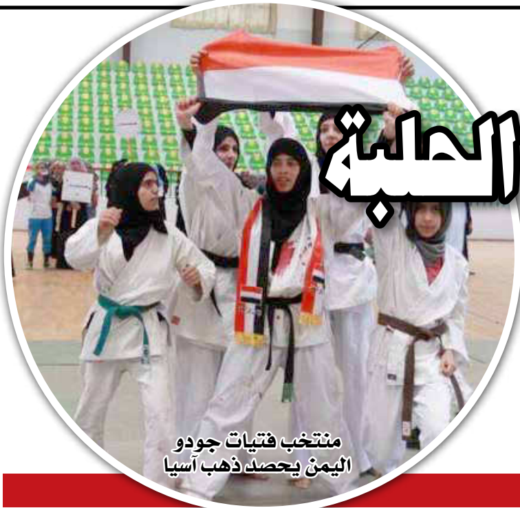
منتخب فتيات جودو اليمن يحصد ذهب آسيا