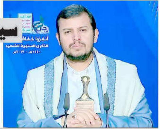
2 | وقع المعركة

إحباط نتيجة عدم تمكنه من احتلال بلدنا وهو يرى المواقف العظيمة لأبناء شعبنا. وأضاف: "العدو تعب في هذا العدوان وقد تكلف خلاله الكثير وسمعة النظام السعودي هي الأسوأ في العالم وإن النظام السعودي وصل