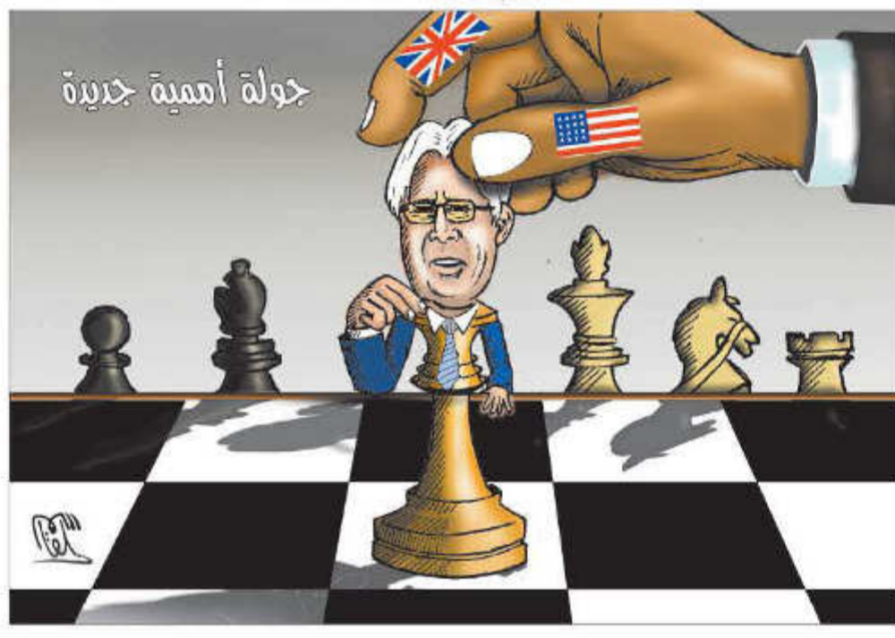
بقية ص 12