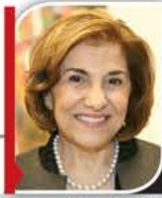
د. بثينة شعبان

المستشارة السياسية والإعلامية للرئاسة السورية