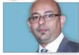
السفير محمد محمد السادة*

النفطية التابعة لشركة أرامكو في بقيق وخريرص على بُعد أكثر من 1400 كم من صنعاء.