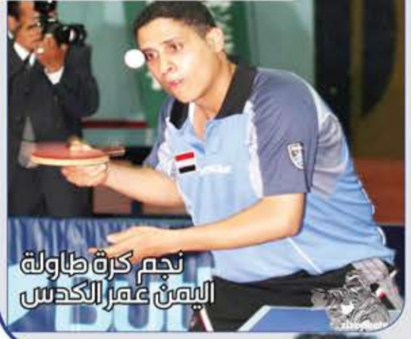
نجم كرة طاولة اليمن عمر الكدس